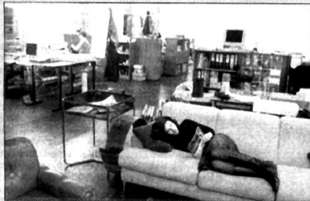
Das Büro wird zum Zuhause, zumindest manchmal: Für Jungunternehmer gelten flexible Arbeitszeiten als Voraussetzung.